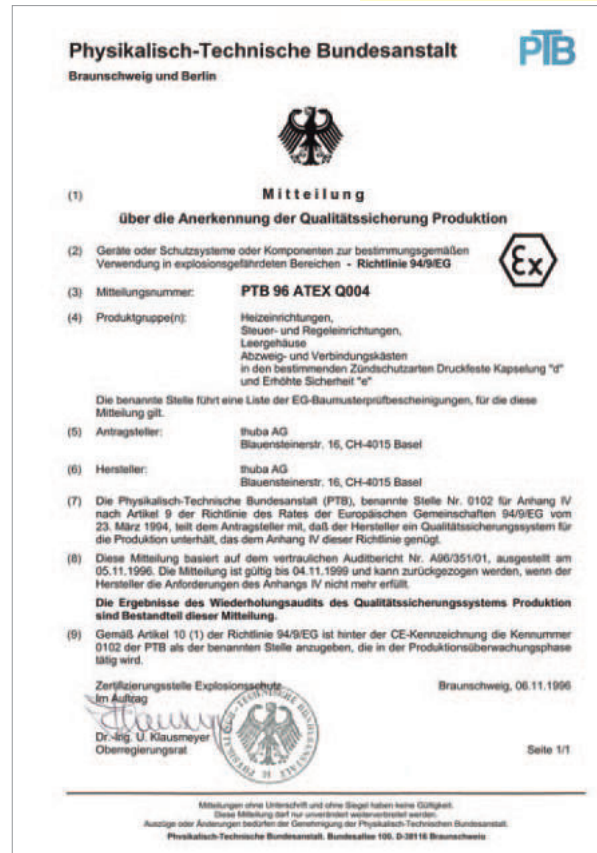
Mitteilung über die Anerkennung der Qualitätssicherung Produktion

module «Production Quality Assurance». Each individual step a challenge for an SME.