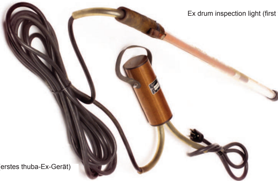
Ex drum inspection light (first thuba Ex device)