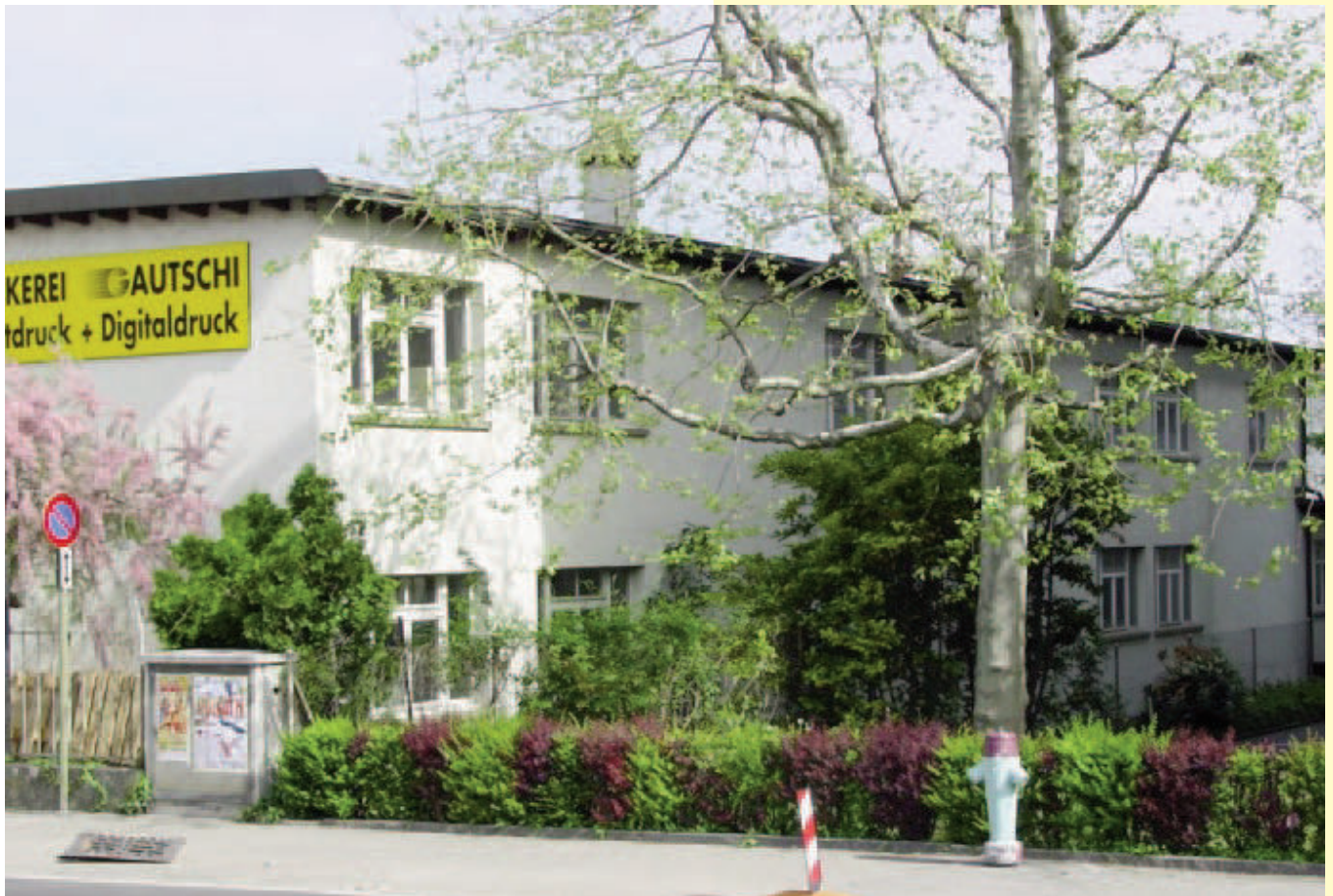
Binningerstrasse 129, Allschwil

Gebr. Thurnherr AG, still based in the Neubad district of Basel.