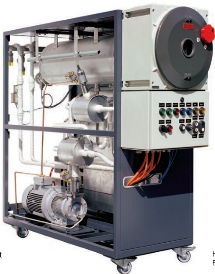
Wärmeübertragungsanlage mit Ex-d-Schaltgerätekombination

In addition to temperature monitors, suitable switch gear assemblies were also needed for the explosionproof heating systems. In the early eighties the company formed a partnership with what was then BBC (Brown Boveri Co.) to manufacture flameproof controls and connection boxes in the type of protection «Increased Safety».